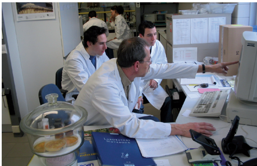
• Leerlingen kijken dankzij Jet-Net mee over de schouders van onderzoekers van DSM.

(vooral grote) bedrijven. Daarnaast – deels overlappend met de hiervoor genoemde scholen – telt Nederland inmiddels 41 Technasiumscholen: havo en vwo met extra bètavakken.